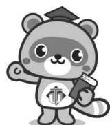
徳島大学マスコットキャラクター とくぼん