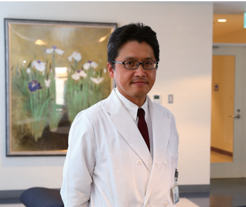
徳島大学大学院医歯薬学研究部 運動機能外科学 教授