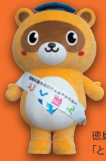
徳島大学マスコットキャラクター 「とくぼん」