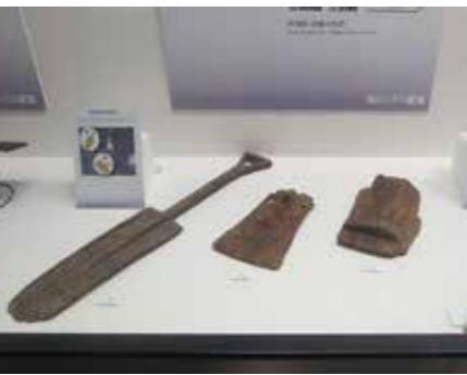
展示された発掘品

庄・蔵本遺跡とは、眉山の北側山麓に広がる遺跡です。本学蔵本キャンパスでは、1982年より、これまで29回にわたる発掘調査が実施されて、縄文時代の終わり頃から近代までの幅広い時代にわたる、数多くの貴重な文化財が発見されています。その中でも、弥生時代の初め頃のものは極めて豊富で、初期の農耕集落遺跡として、学界で注目されています。弥生時代は米作りが始まった時代とされていますが、しかし、今回の展示会では当時の人々は、米だけではなく雑穀をも栽培していたことや、多様な食材を手に入れ、調理して食べていたことが分かります。この展示にあわせて、本