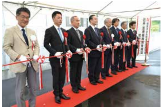
7月8日 生物資源産業学部創設・医療機器 開発施設開所記念式典を挙げる

徳島大学は生物資源産業学部農場に新設した創設・医療機器開発施設の開所を記念する式典を挙行しました。 本施設は、疾患モデルブタの複製および飼育のためのクリーン飼育設備、作製した疾患モデルブタの検査設備、胚移植・実験や外科