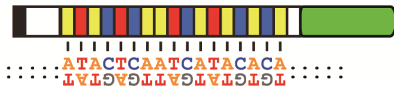
図 1 TALE-FP の分子構造 先端に核内移行配列を持つ、中央部分のドメインは DNA 配列特異的に結合する。末端に蛍光タンパク質を持つ。

本研究は、東京理科大学において、文部科学省・新学術領域・科学研究費「植物の成長可塑性を支える環境認識と記憶の自律分散型統御システム」および国立研究開発法人 科学技術振興機構（JST） 戦略的創造研究推進事業 チーム型研究（CREST）「二酸化炭素資源化を目指した植物の物質生産力強化と生産物活用のための基盤技術の創出」（研究総括：磯貝 彰 奈良先端科学技術大学院大学 名誉教授）（研究課題名「エピゲノム制御ネットワークの理解に基づく環境ストレス適応力強化および有用バイオマス産生」、研究代表者：関 原明（理化学研究所 環境資源科学研究センター チームリーダー）の助成を受けて実施した研究成果です。