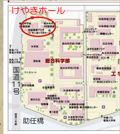
常三島キャンパスマップ

会場: 徳島大学 総合科学部 常三島けやきホール (2F) 〒770-8502 徳島市南常三島町1丁目1番地 http://www.tokushima-u.ac.jp/campusmap/#josanjima