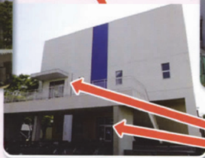
体育館 2階入口 1階入口