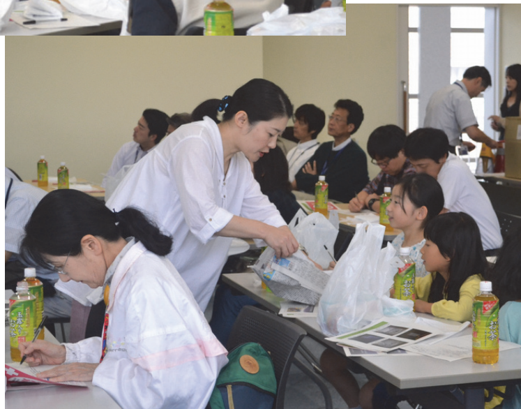
マイトイレの 見本説明