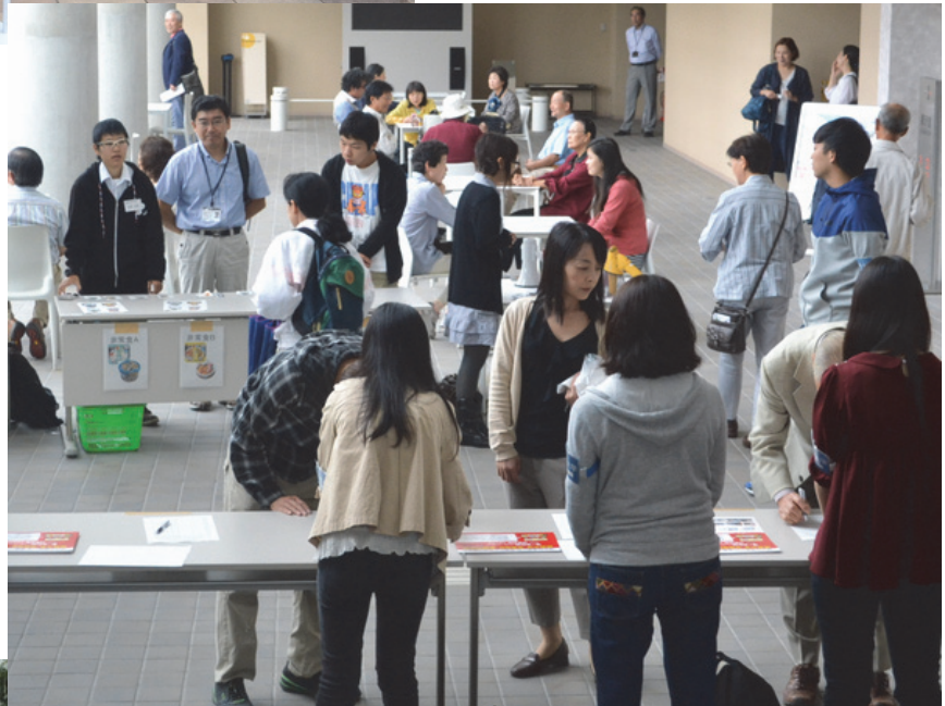
名簿記入と 非常食選び