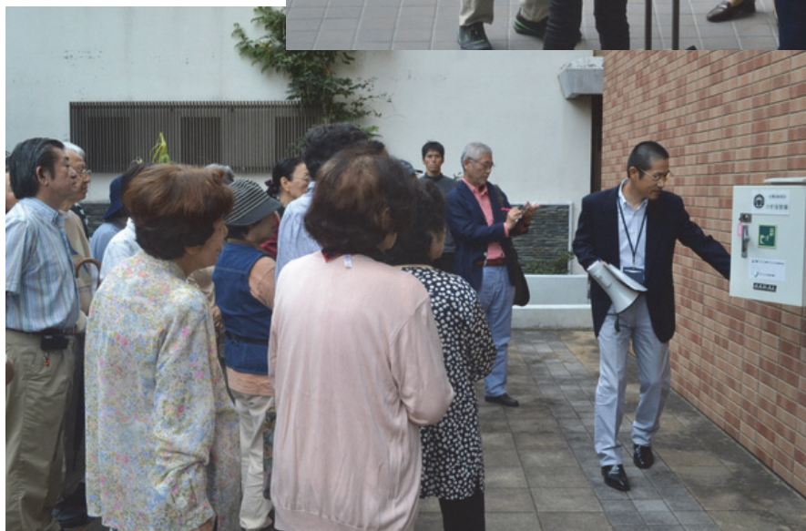
感震かぎ 保管庫の 説明