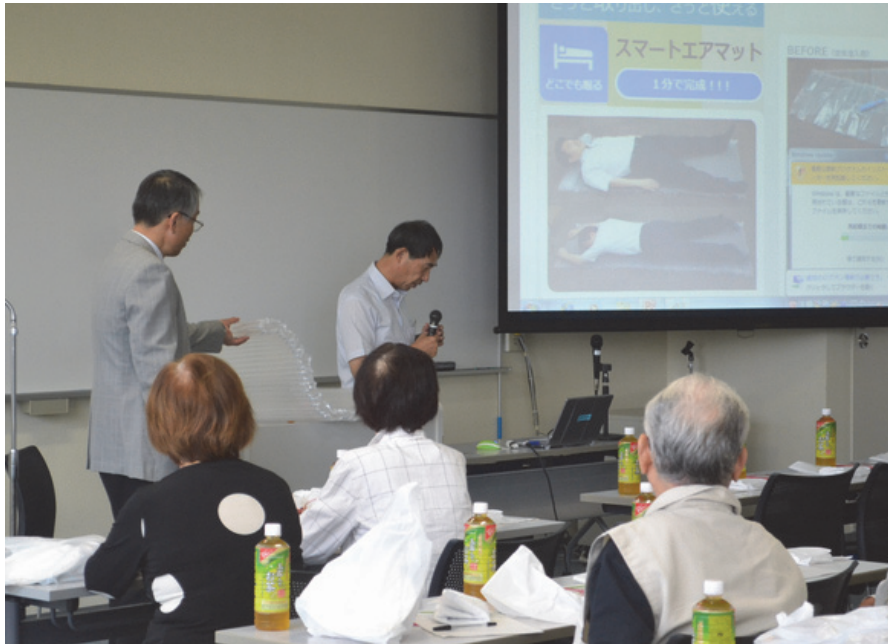
エアー マットの 説明