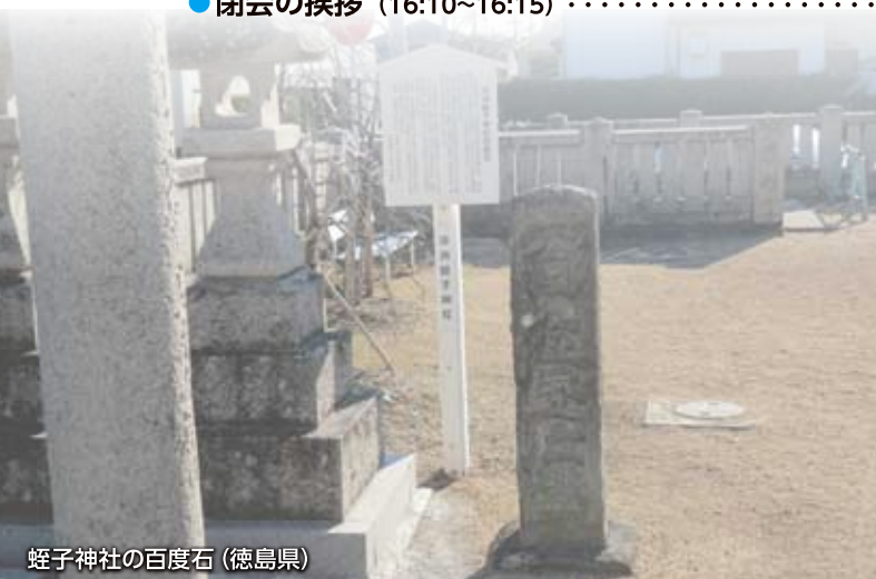
蛭子神社の百度石 (徳島県)