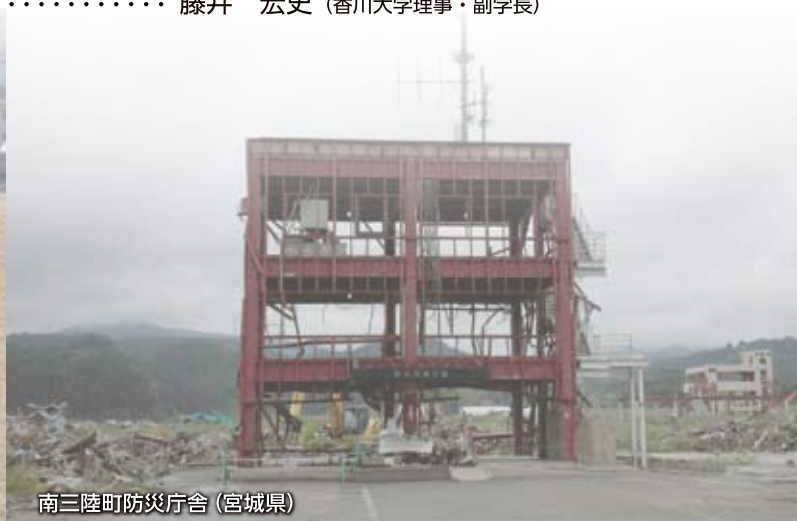
南三陸町防災庁舎 (宮城県)