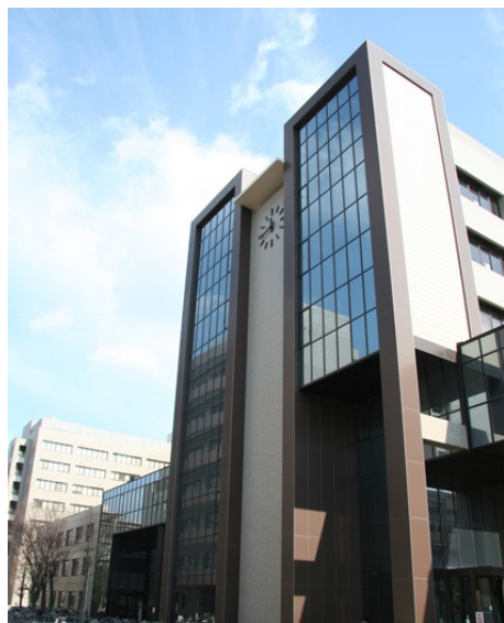
工学部共通講義棟 2階K206