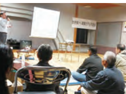
住民放射線学習会 (福島県白河市)