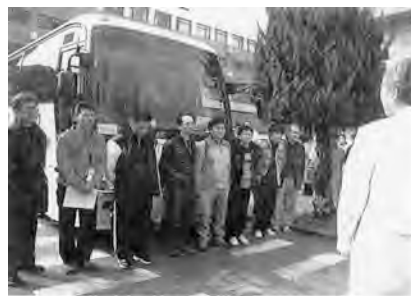
山形市に派遣された医療支援チームの出発式—徳島市の徳島大学病院

今、若い医師の大都市集中化、それに伴う地方医療の空洞化が問題となっています。いろいろな原因が議論され、その対応も叫ばれています。天の邪鬼な性格のためか、それらの対応の多くは付け焼き刃の感を拭えませんが、それらの対応の多くは付け焼き刃の感を拭えませんが、10年後、20年後に振り返った時に正しい対応であったと判断されることは難しいことです。何よりも最高の医療を提供できる施設であるように日頃から心がけていることと、それを継続することが大切ではないでしょうか。それができるかどうかは非常に難しいことで、継続できれば必ずいろいろな問題も解決できるはずで、逆に、これが実行できなければ、いかなる対応も付け焼き刃でしかありません。今回の震災支援は徳島大学病院が腰を据えた医療、活動ができることを示した顕著な例です。その一員として診療にあたることができることに誇りを持つとともに、感謝の気持ちを忘れずにいたいと感じています。