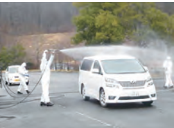
自衛隊特殊部隊との 自動車除染

現在徳島大学においては、パイロット事業支援プログラムによる被災地共存型の支援が継続されている。能力を有する機関による積極的な支援活動は責務である。被災地の一日も早い平穏、復興を願いつつ、活動を応援したい。