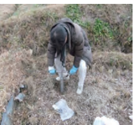
避難勧奨地域の棚田における 土壌調査の様子