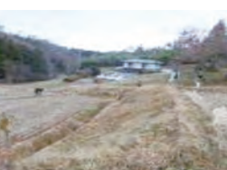
基準値越え作物産地の 水田調査