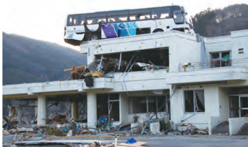
惨状。屋根に残ったバス

仙台市から名取市、石巻市に向かうと光景は一変した。戦場と変わらない惨状。違うとすれば、建物の壁に銃痕がなく、不発弾などが転がっていないだけか。海外の紛争地を見慣れた目にも、被災地の衝撃は桁外れだった。どんな言葉でも表現できないリアリティに、佇立するしかなかった。