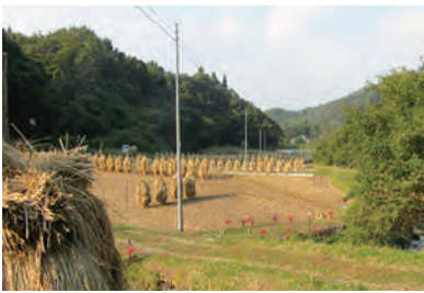
避難勧奨地域における 米穀収穫風景 (23年10月9日撮影)

東日本大震災に伴う東京電力福島第一原子力発電所の事故による環境放射能汚染は福島県をはじめとして広範囲に及び、放射線量が局所的に高いホットスポットを形成している。政府は12月中旬に原子力施設内における災害の収束を宣言したが、被災地域住民にとって災害は全くもって未収束である。低環境放射能被ばくの不安の下で生活の糧を奪われた日々がある。福島県および近隣の農林水産業、観光業、飲食業の大半は壊滅的な打撃を受け、補償も十分に為されていないのが現状である。福島原子力災害から1年近く経過した現在でもどのように生活を再建できるかまだ先が見えない日々が続いている。