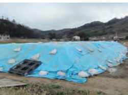
野積み物の除染廃棄物