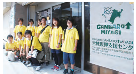
宮城復興支援センターでボランティア活動する学生

ターの協力を得て、学生9人が南三陸町や仙台市において支援物資の整理、仮設住宅の生活支援、物産店の接客・販売などに従事した。