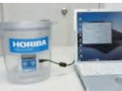
可搬型放射能検出キット