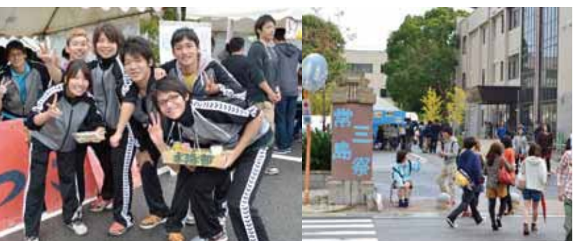
(蔵本祭)模擬店も盛り上がりました