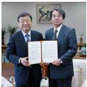
呉ソウル国立大学長(左) 香川徳島大学長(右)

徳島大学は、10月25日にソウル国立大学と学術及び研究交流に関する大学間交流協定を締結しました。