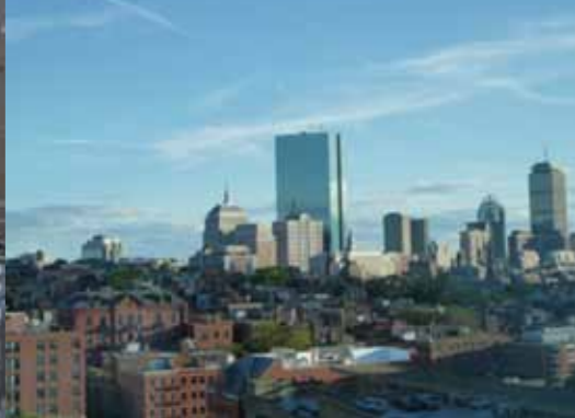
ラボからの風景 (ダウンタウン)