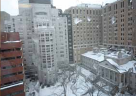
ラボからの風景 (エーテルドーム)