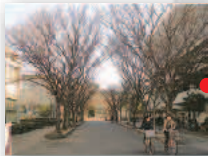
総合科学部玄関前 ケヤキ並木