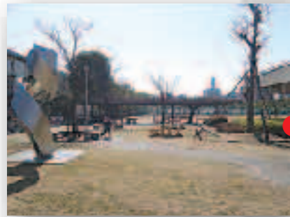
ベンチのある芝生の広場。