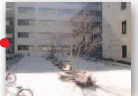
工学部中庭 [キャンパスモール]