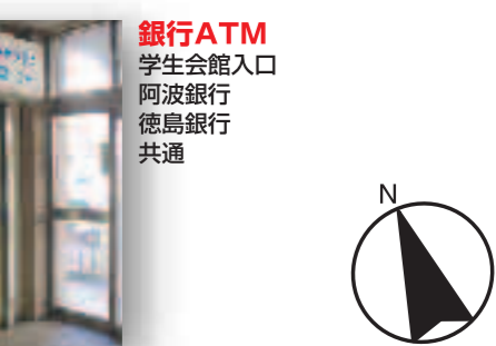
銀行ATM 学生会館入口 阿波銀行 徳島銀行 共通