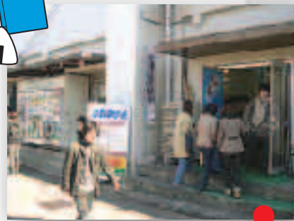
生協売店 営業時間10:00-18:00 旅行代理店もあります。