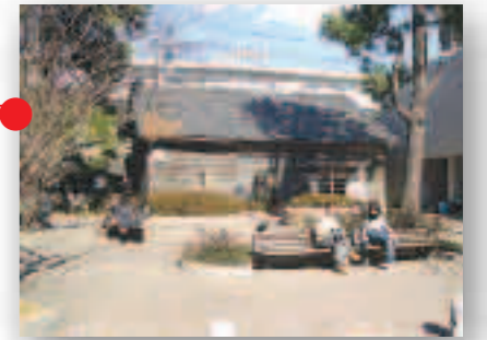
理髪室 1942年から営業している 歴史的建築物(?) 市価より安い 前の広場は桜が美しい