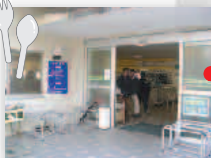
第一食堂 (土曜日休業) 1階食堂 8:15-20:00 8:15-11:00 おにぎり販売 11:30-20:00 全メニュー 13:00-14:00 めん類休み 2階食堂 11:00-12:30 全メニュー