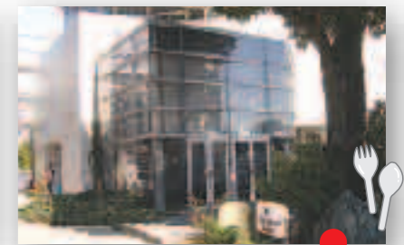
エルボ・インディゴ(レストラン)