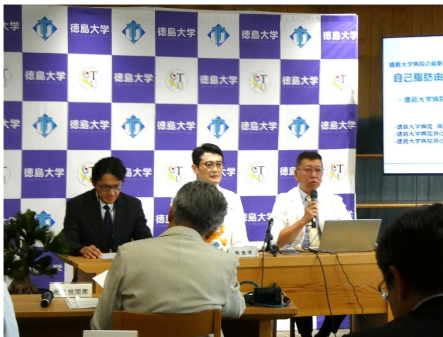
自己脂肪由来再生 \beta 細胞移植、世界初の臨床応用へ — 徳島大学病院、1型糖尿病に対する医師主導治験で第一症例を実施 —