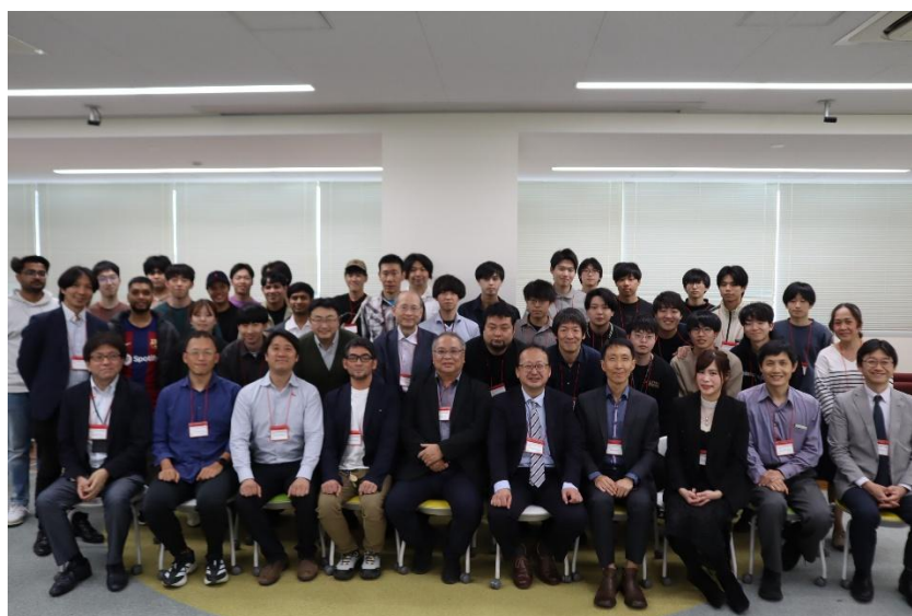
国立台湾大学及び Academia Sinica と合同ワークショップを開催しました