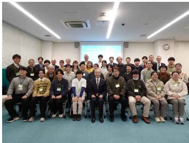
令和7年度学生と学長との懇談会を開催しました