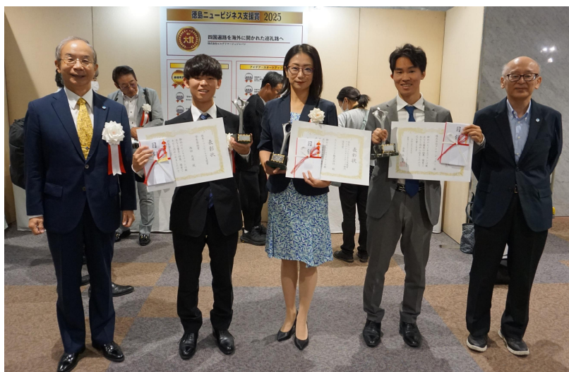
ビジネスチャレンジメッセ TOKUSHIMA2025 に出展しました