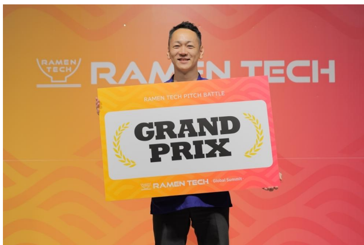
徳島大学発ベンチャー「amidex」がピッチコンテストで優勝しました