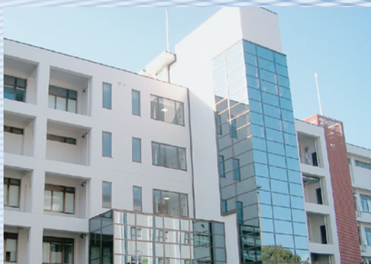
医科栄養学科 School of Medical Nutrition