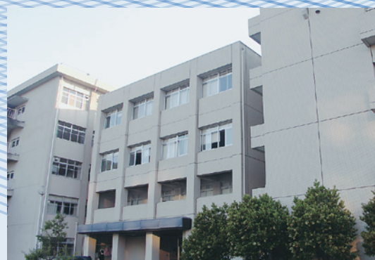
保健学科 School of Health Sciences