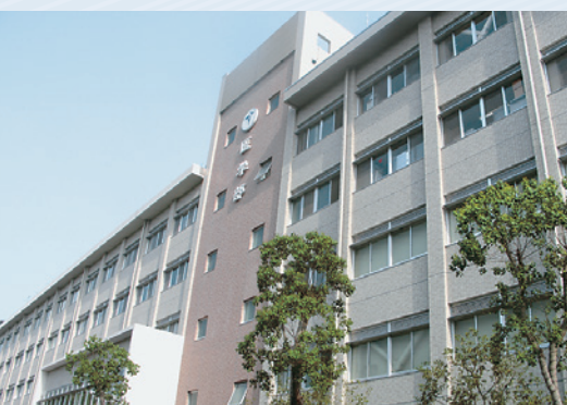
医学科 School of Medicine