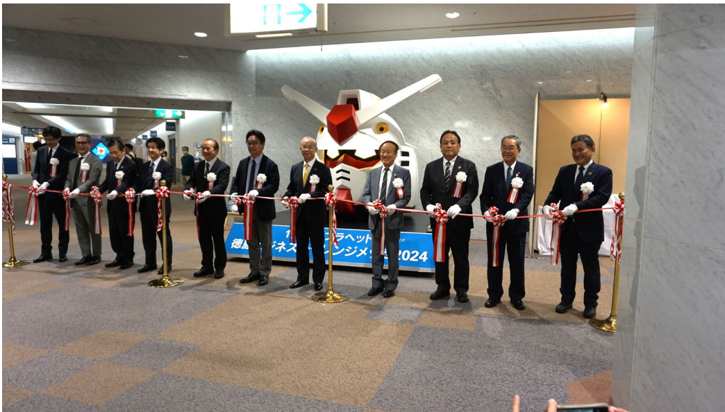
大学発のベンチャー企業が徳島ニュービジネス支援賞の大賞を受賞しました