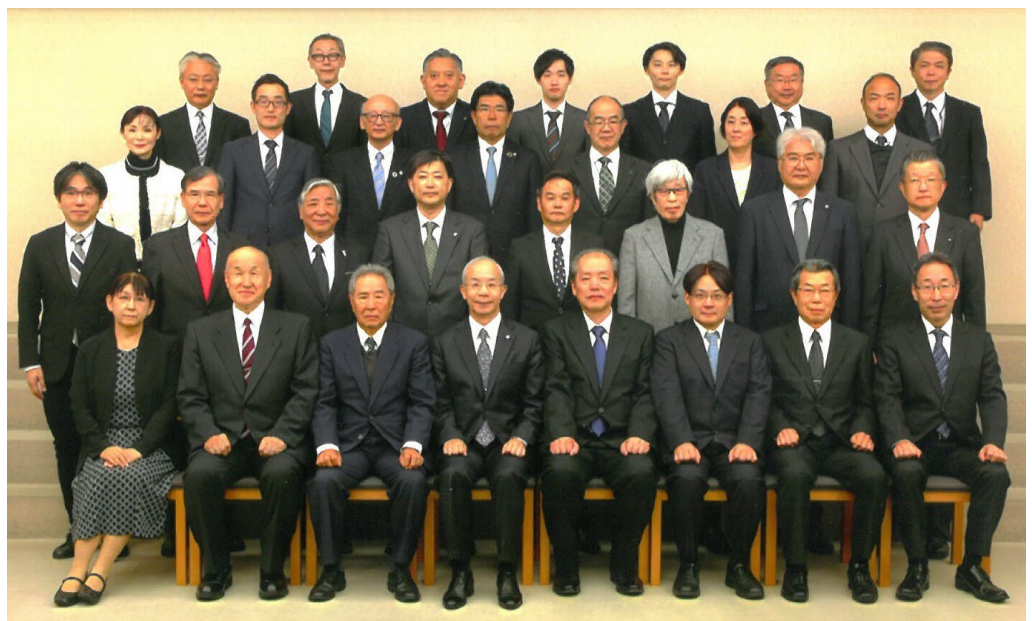
令和6年度関東びざん会を開催しました