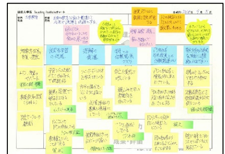
完成した TP チャートのイメージ

ワークショップでは、他者との対話を通してより深い振り返りができ、 多様な教育のあり方について知る ことができます。