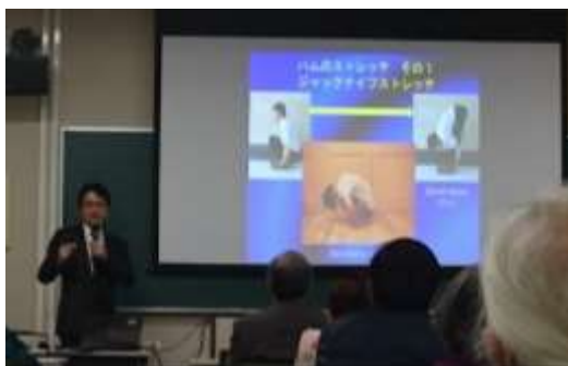
健康医学講義の授業

個別の実践課程修了(2 年間 30 時間以上)の有無については事務室までお問い合わせください。