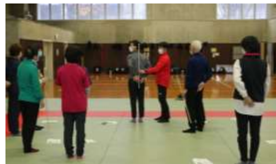
ロコモ予防運動実習