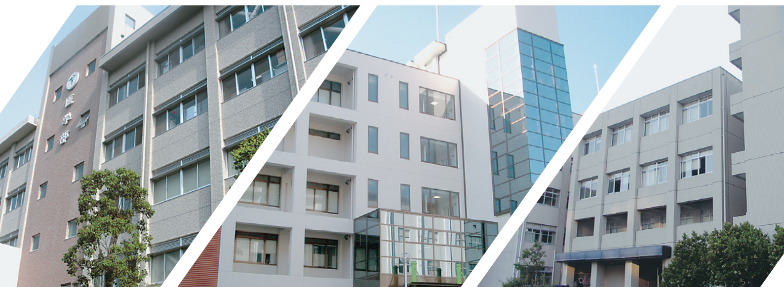
医学科 School of Medicine