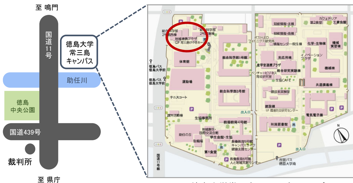
徳島大学常三島キャンパスマップ (〒770-8502 徳島市南常三島町1丁目1)