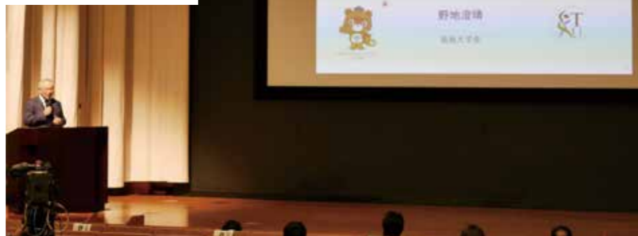
SDGsと徳島大学の取り組みを紹介する野地学長