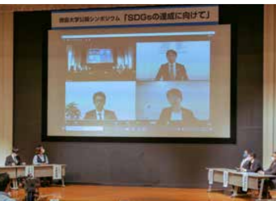
意見交換の様子 (企業のパネリストはオンラインで参加)