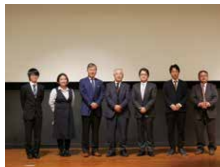
長井記念ホールの登壇者