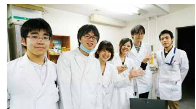
研修医の仲間と(著者左から3人目)

で、このような環境があるのも地域の皆様のご理解、先生方のご尽力のおかげであり、大変恵まれた環境です。また多くの仲間がいるため、研修医同士休日を楽しんだり、悩みや心配事を相談したり、これもまた、大人数が研修している大学病院ならではの利点です。歯科医師過剰と言われていた今日ですが、徳島大学では歯科医師が不足しており、また開業医さんからの求人もたくさんあります。都会で働くことも素晴らしいことですが、おだやかな地域性を持つ徳島で働くことも素晴らしいと私は実感しています!