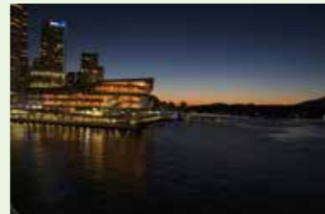
ダウンタウンの夜景

402haを誇る広大なキャンパスの中には、文化人類学博物館、新渡戸記念庭園など、歴史的な建造物も多数あり、バンクーバーの観光名所ともなっています。