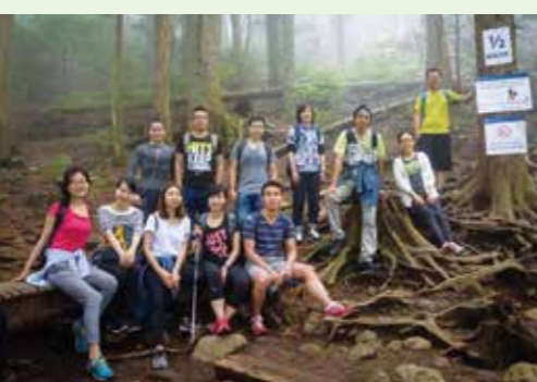
ラボメンバーとその友人と共にグラウスマウンテンにて(右から4番目が著者)

れ歯を専門とする補綴科、虫歯や歯周病の治療をする保存科、抜歯や主に口腔領域のがんの治療をする口腔外科、小児歯科、矯正歯科など他にも様々な科に分かれています。徳島大学の研修プログラムは、これらの中からどれか一つに絞り集中して研修を受けられるコースや、複数の科を組み合わせて研修を受けられるコースがあります。学生生活の中ではつきりとした目標を持つことができた人は単科のコースへ進みますが、多くの研修医はひとまず一通りの歯科治療の流れを学ぶため複数の科を選択します。どの科の先生も、非常に丁寧な指導をしてくださいます。決して丸投げでなく、先生方の確認が細やかなステップで加わる環境は徳島大学ならではの