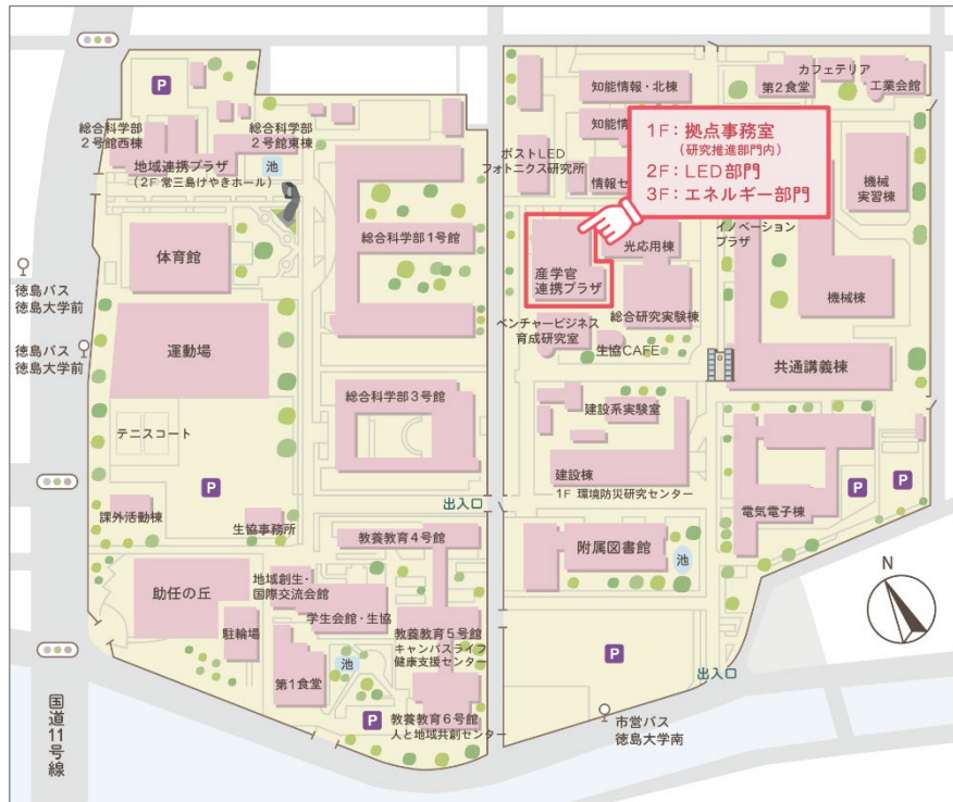
キャンパスマップ (常三島)