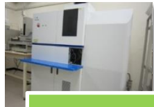
ICP発光分光分析装置