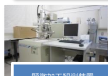
顕微加工観測装置