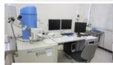
微細構造観察装置