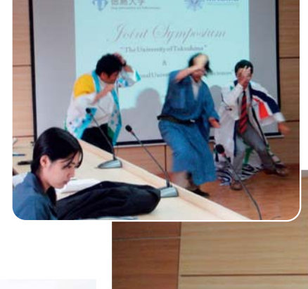
シンポジウム・オープニ ングセレモニーで阿波踊 りを披露する