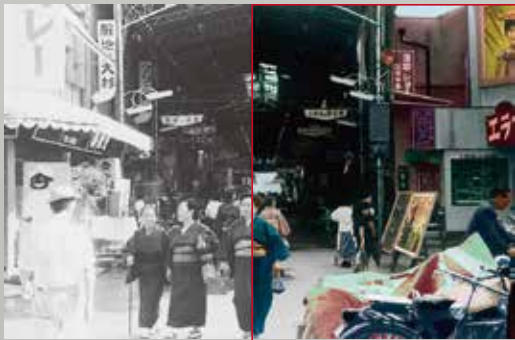
東新町交差点より籠屋町を望む