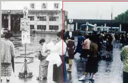
昭和20年代の徳島駅