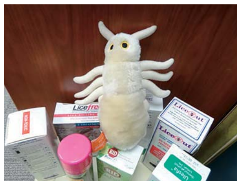
写真7 アタマジラミのぬいぐるみと薬

した高齢者ケアに関する研究活動を行っている。そのため、本施設を利用する利用者・家族に対して、研究の同意を得ているという。