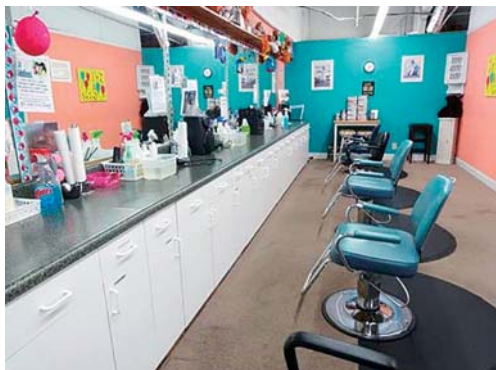
写真8 Lice solutions の処置室