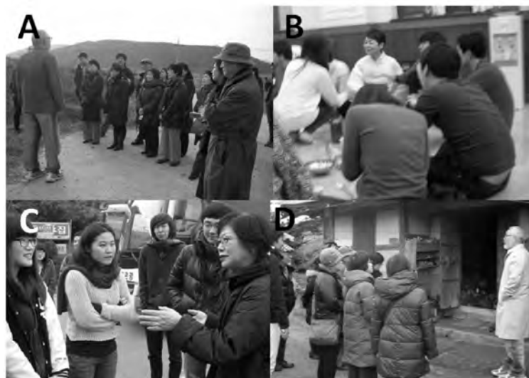
図3 珍島の歴史と人の交流を生かした体験プログラム

このような世代を超えて継承するべき伝統文化に関して、日本の地域社会においても同様であり、