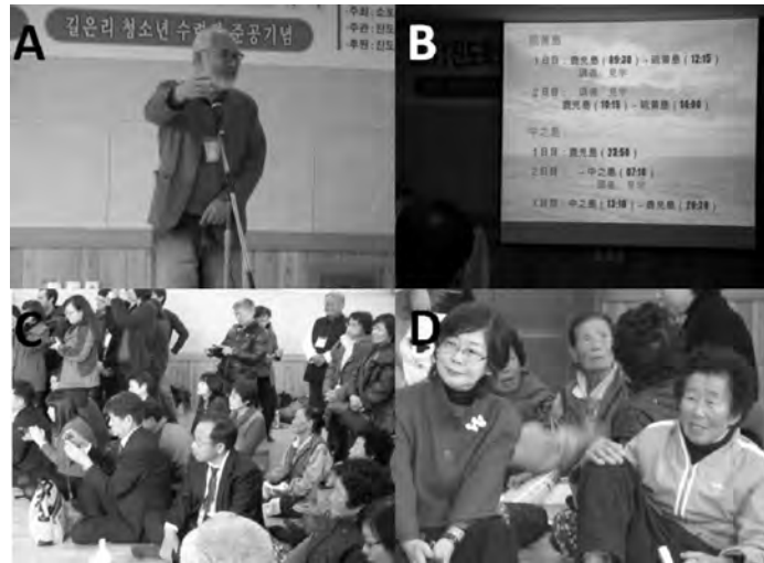
図1 2011 International Academic Conference (Academic Society of Jindo Studies)