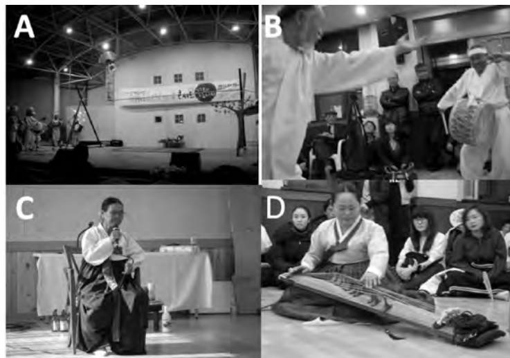
図4 珍島の伝統文化

グローバル化する世界の中で、とりわけ大学教育における国際化は重要な課題と考えられる。とりわけ、近隣諸国との関係は様々な面から取組を進めて行く必要があると考えられる。しかしながら、日本と韓国についてみると、これまでの長い歴史の中で両国は深い関係にあったにも関わらず、大学間交流に関して両国の関係は、必ずしも十分とは言えない面があった。とりわけ歴史的な面をとりあげての交流は政治的な面も関連して難しい面があった。今回の取組は、近代国家から見た両国間の関係という面を排して、民族としての観点から、祖先との繋がりについて体験を通して考え