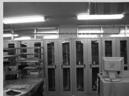
5S(整理、整頓、清潔、清掃、しつけ)の徹底