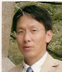
分子創薬化学分野 教授