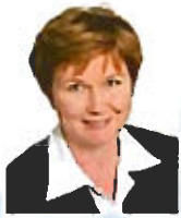
Sinikka SALO, D.D.S., Ph.D. (Deputy Mayor of Oulu, Finland)