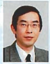
日野出大輔 徳島大学教授