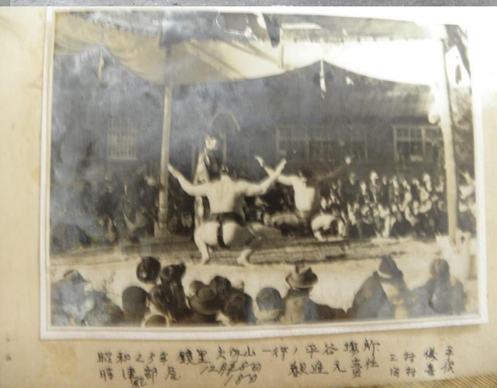
昭和25年12月18日 丹生谷山奥 相撲場 時津風親方 木村庄之助

主催：地域再生塾丹生谷応援団・徳島大学地域再生塾 協力：那賀町 お問い合わせ先：那賀町役場まち・ひと・しごと戦略課 (電話 0884-62-1184) (この取り組みには、徳島県企業局ダム水源地サポート事業の助成を受けています。)