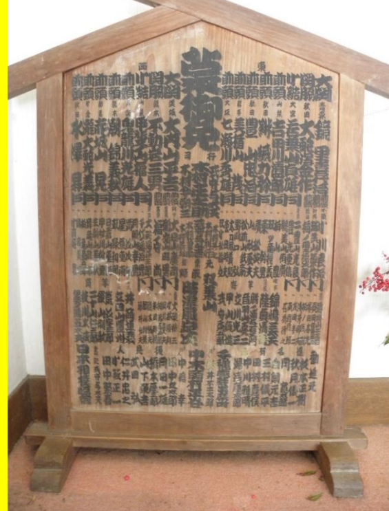
(田村旅館に残る板番付)

「昭和25年12月18日、このころ世はまだ敗戦から日も浅く、復興への途中であった。衣食住とも不安定な時であったが、丹生谷のこの山奥に双葉山門下一行が入山し相撲興行をするということは、戦後の大きなニュースであった。」(上那賀町誌から)