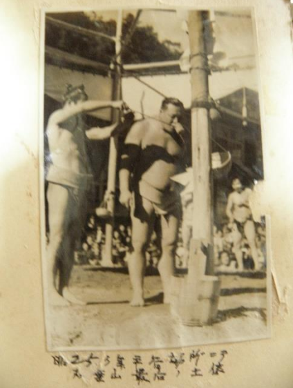
昭和25年12月18日 丹生谷山奥 相撲場