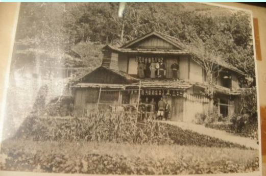
明治末期創業当時ノ当館風景

時津風親方(元横綱 双葉山) 木村庄之助(立行司)らが宿泊した明治末創業の老舗旅館、先代ご主人が残したアルバムや日記などから、当時の興奮と心意気が伝わってきます。